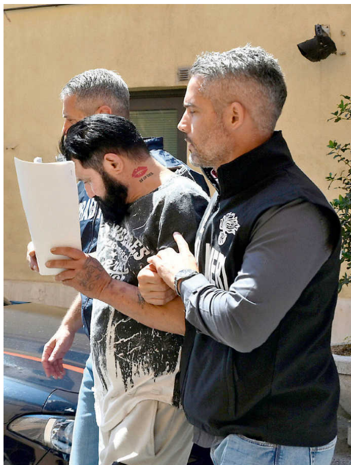
La scorsa settimana i carabinieri hanno arrestato quattro persone per l'attentato a Sigfrido Ranucci. Nella foto, uno di loro portato via dalla sede del reparto operativo del Nucleo investigativo di Roma

Lavitola fantasticava di far diventare Ranucci il leader del campo largo "Quando arriverai a Palazzo Chigi io sarò il tuo Gianni Letta"